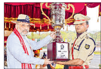
एजेसी ▶▶ कटक

केंद्रीय गृह एवं सहकारिता मंत्री श्री अमित शाह ने शुक्रवार को ओडिशा के मुंडली में सीआईएसएफ (केंद्रीय औद्योगिक सुरक्षा बल) के 57वें स्थापना दिवस समारोह को मुख्य अतिथि के रूप में संबोधित किया। उन्होंने 890 करोड़ की लागत से 3 आवासीय परिसरों का शिलान्यास और 2 आवासीय परिसरों (राजरहाट और दिल्ली) का लोकार्पण किया। शाह ने कहा कि सीआईएसएफ ने 56 वर्षों में औद्योगिक सुरक्षा क्षेत्र में शून्य से शिखर तक का सफर तय किया है। उन्होंने बल, त्याग और समर्पण की इस यात्रा को औद्योगिक विकास और देश की अर्थव्यवस्था की मजबूती से जोड़ा। औद्योगिक विकास को सुरक्षित बनाने के लिए सीआईएसएफ की भूमिका अहम है और देश के हवाई अड्डे, बंदरगाह और बड़ी औद्योगिक इकाइयों इसकी सुरक्षा पर निर्भर हैं।