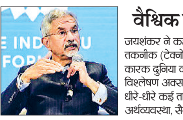
ताकत का मतलब जीडीपी नहीं: विदेश मंत्री के मुताबिक आज ताकत का मतलब सिर्फ जीडीपी या सैन्य शक्ति नहीं रह गया है। दुनिया के अलग-अलग हिस्से अलग-अलग क्षेत्रों में मजबूत हो रहे हैं, इसलिए वैश्विक शक्ति अब कई देशों और क्षेत्रों में फैली हुई है।

नई दिल्ली (एजेंसी)। वैश्विक तनाव के बीच विदेश मंत्री डॉ. एस. जयशंकर ने कहा कि आज कोई भी देश पूरी तरह से हावी नहीं है। रायसीना डायलॉग 2026 में बोलते हुए विदेश मंत्री ने पिछले सात दशकों में वैश्विक शासन के विकसित होते स्वरूप पर विचार व्यक्त किए। उन्होंने कहा कि जब हम इन 70 वर्षों को पीछे मुड़कर देखते हैं, तो मुझे लगता है कि 1945 या 1989 को हमेशा के लिए स्थिर करने की उम्मीद एक बहुत ही अवास्तविक उम्मीद थी। उन्होंने कहा कि 1945 या 1989 के बाद बने विश्व व्यवस्था को हमेशा के लिए बनाए रखने की उम्मीद करना अवास्तविक था। उन्होंने कहा कि पिछले 70 साल को अगर इतिहास के नजरिए से देखें तो यह भारत के हजारों साल के इतिहास का सिर्फ एक छोटा हिस्सा है, इसलिए दुनिया का बदलना स्वाभाविक है।