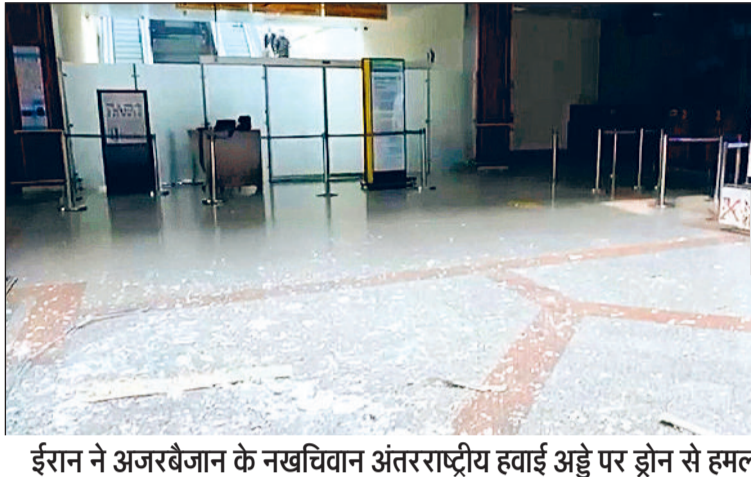
ईरान ने अजरबैजान के नखचिवान अंतरराष्ट्रीय हवाई अड्डे पर ड्रोन से हमला किया

ईरान फारस की खाड़ी में अमेरिकी उपस्थिति को समाप्त करेगा