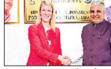
सारा मुलताल्ला और भूपेंद्र यादव

नई दिल्ली (एजेंसी)। भारत और फिनलैंड के बीच पर्यावरण सहयोग को मजबूत करने की दिशा में महत्वपूर्ण कदम उठाया गया है। दोनों देशों ने वर्ष 2020 में हस्ताक्षरित पर्यावरण सहयोग से जुड़े समझौता ज्ञापन का नवीनीकरण किया है, जिससे प्रदूषण नियंत्रण, अपशिष्ट प्रबंधन, चक्रীয় अर्थव्यवस्था और जलवायु कार्रवाई के क्षेत्रों में साझेदारी को और मजबूती मिलेगी। केंद्रीय पर्यावरण, वन एवं जलवायु परिवर्तन मंत्री भूपेंद्र यादव ने एक्स पर जानकारी साझा करते हुए कहा कि फिनलैंड सरकार की जलवायु एवं पर्यावरण मंत्री सुश्री सारी