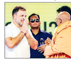
एजेसी ▶▶ कोल्लम

नेता प्रतिपक्ष राहुल गांधी ने कोल्लम में महात्मा गांधी की शिवगिरि मठ यात्रा की 100वीं वर्षगांठ पर जनसभा को संबोधित किया, जहां उन्होंने श्री नारायण गुरुदेवन से मुलाकात की थी। राहुल ने कहा कि संविधान में क्षमा है, नारायण गुरुजी में क्षमा है। वर्तमान में राजनीति और अंतरराष्ट्रीय संबंध ज्ञान से दूर, अंधकार की ओर बढ़ रहे हैं। चाहे राजनीति हो या अंतरराष्ट्रीय संबंध, दूसरे व्यक्ति को समझने का कोई प्रयास नहीं किया जाता और असहमति के मामलों में हिंसा का सहारा लिया जाता है।