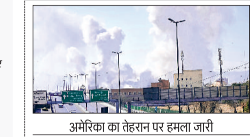
अमेरिका का तेहरान पर हमला जारी

28 फरवरी से शुरू हुई जंग का आत सातवां दिन है। ऐसे में रोजाना मृतकों का आंकड़ा बढ़ रहा है। ईरानी रेड क्रॉस की रिपोर्ट के अनुसार अब तक अमेरिका और इजराइल के हमलों में ईरान में कम से कम 1,332 लोग मारे गए हैं। वहीं, लेबनान में 100 से ज्यादा और इजराइल में करीब एक दर्जन लोगों की जान जा चुकी है। वहीं, संयुक्त राष्ट्र के मानवाधिकार प्रमुख वोल्कर तुर्क ने ईरान के स्कूल में हुए हमले की जांच करने की अपील की। इस हमले में 175 लोगों की मौत हो गई थी। तुर्क ने जिनवो ने कहा कि अमेरिका ने इस हमले की जांच की घोषणा की है। संयुक्त राष्ट्र चाहता है कि यह जांच जांच, पारदर्शी और निष्पक्ष तरीके से पूरी की जाए। इसके साथ ही हमले के लिए जिम्मेदार लोगों की जांचबंदी तय होनी चाहिए। पीड़ितों को व्यापक और उचित मुआवजा भी मिलना चाहिए। इस बीच, अमेरिकी रक्षा मंत्री पीट हेगसेथ ने कहा कि अमेरिका मिनाब में हुए इस हमले की जांच कर रहा है।