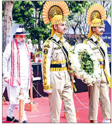
कार्यक्रम में गृहमंत्री शाह

शाह ने बताया कि सीआईएसएफ अब भारत के 70 हवाई अड्डों सहित 361 महत्वपूर्ण संस्थानों की सुरक्षा कर रहा है। इन सुरक्षा में भी इसे नोडल एजेंसी बनाया गया है। सीआईएसएफ निजी औद्योगिक समूहों को भी हाईब्रिड मोड में सुरक्षा प्रदान