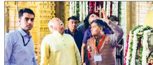
एजेसी ▶▶ जैसलमेर

संघ प्रमुख डॉ. मोहन भागवत ने जैसलमेर में आयोजित चादर महोत्सव के दौरान एकता और सद्भावना का संदेश देते हुए कहा कि दुनिया में युद्ध और कलह इसलिए नहीं थम रहे क्योंकि हम अपनी आंतरिक एकता को भूल चुके हैं। जब तक हम स्वार्थ को त्याग कर एक मजबूत समाज के रूप में खड़े नहीं होंगे तब तक सच्ची शांति नहीं आएगी। भागवत ने कहा कि समाज अपनी एकता को नहीं पहचाना इसलिए दुनिया भर में कलह जारी है। लोग मन की करुणा भूल गए हैं। लोग इस सत्य को भूल गए कि हम दिखते अलग अलग हैं लेकिन सब एक हैं। संघ प्रमुख ने कहा कि जब पहला महायुद्ध हुआ तो दोबारा जंग न हो इसके लिए 'लीग आफ नेशंस' की स्थापना की गई लेकिन वह भी नहीं चली। फिर दूसरा महायुद्ध हो गया। आज संयुक्त राष्ट्र निष्प्रभावी है। युद्ध थमने का नाम नहीं ले रहे हैं।